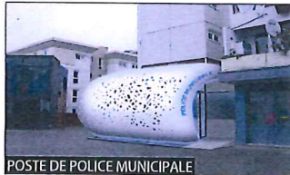
POSTE DE POLICE MUNICIPALE