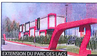
EXTENSION DU PARC DES LACS