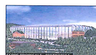
SERRE TROPICALE - BIOTROPICA