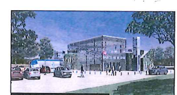
RENOVATION DE LA GARE