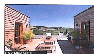
LA CHENAIE 3