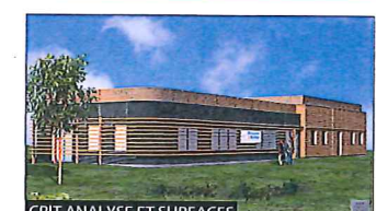
CRIT ANALYSE ET SURFACES