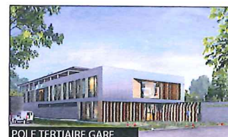
POLE TERTIAIRE GARE