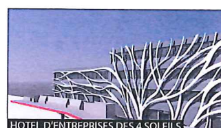
HOTEL D'ENTREPRISES DES 4 SOLEILS