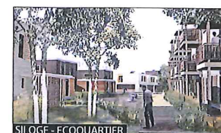
SILOGE - ECOQUARTIER