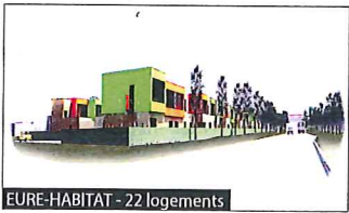
EURE-HABITAT - 22 logements