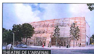
THEATRE DE L'ARSENAL