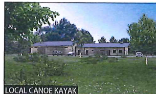
LOCAL CANOE KAYAK